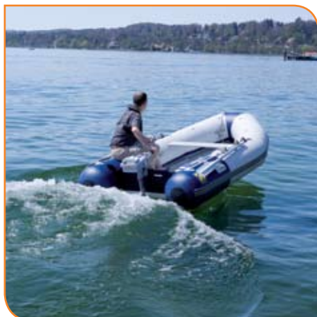
Grande spinta propulsiva per il Travel 1003 equivalente ad un motore a scoppio di ben 3 Hp

Sicurezza: Il motore si spegne quando la chiave magnetica posta sulla barra di guida viene rimossa. Quindi, per ragioni di sicurezza, deve essere allacciata al polso o al salvagente.