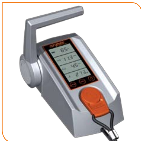
Il telecomando elettronico a distanza si avvale del ricevitore GPS per fornire importanti dati per la navigazione come l'autonomia e la velocità