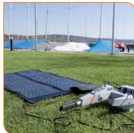
Il nuovo pannello solare resistente all'utilizzo in ambiente marino si può utilizzare anche sul modello Ultralight 403